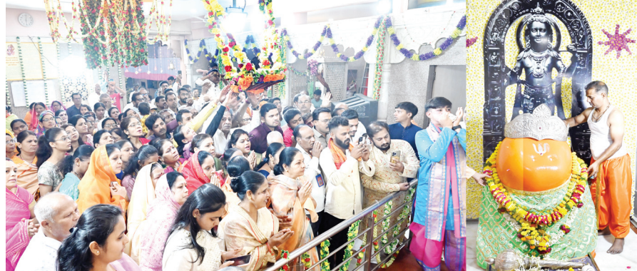
अहमदनगर : सजेंपुरा येथील दक्षिणमुखी हनुमान मंदिरात आज पहाटे भक्तिपूर्ण वातावरणात हनुमान जयंती साजरी करण्यात आली. त्या वेळी मोठ्या संख्येने भाविक उपस्थित होते.

निसर्गाने सद्भावनेने माणसाला श्रीफळातून शुध्द पाणी उपलब्ध करून दिले आहे. देवाची करणी ! नाराळात पाणी या म्हणीप्रमाणे ही देवाची देणगी आहे.मुख्य म्हणजे, ते पाणीसुध्दा गोड असते. याउलट माणसाचं आहे. " माणसाची करणी ! बाटलीत पाणी " पण, ते बाटलीतील पाणी शुध्द असेल याची खात्री नसते. शिवाय, ते गोड तर अजिबात नसते. अशी ही माणसाची म्हण आहे. आता याच बाटलीच्या पाण्याचा व्यवसाय काही माणसं, कंपन्या करीत आहेत. त्यापासून अमाप पैसा कमवीत आहेत. गरीब माणसांना प्यायला पाणी नाही आणि श्रीमंत लोक पाण्याचा गैरवापर करीत आहेत. अशा वृत्तीच्या माणसांच्या कृत्यांना आळा हा घातलाच पाहिजे. सर्व जणांना पाण्याचे समान वाटप झाले पाहिजे. सन २०२३ आणि आताच्या २०२४मध्ये तर पावसाचा कालावधीच पुर्णपणे बदलून गेला आहे. हिवाळ्यात आणि कडक उन्हाळ्यातही कुठे मुसळधार पाऊस पडत आहे तर कुठे गारपीट होत आहे. तीही प्रचंड प्रमाणात